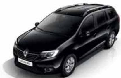
676 Чорна перлина