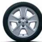
Легкосплавний диск Nepta R15