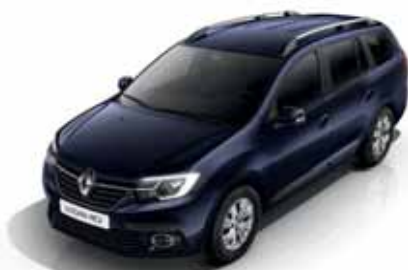
D42 Синій Navy (лак)*