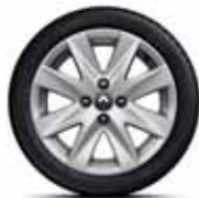
Легкосплавний диск Symphonie R15