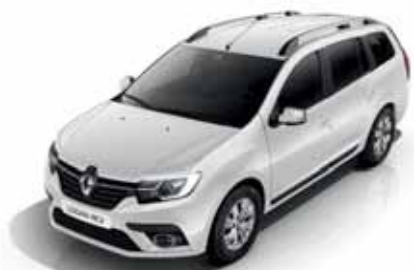
369 Білий лід (лак)