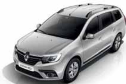
D69 Сіра платина