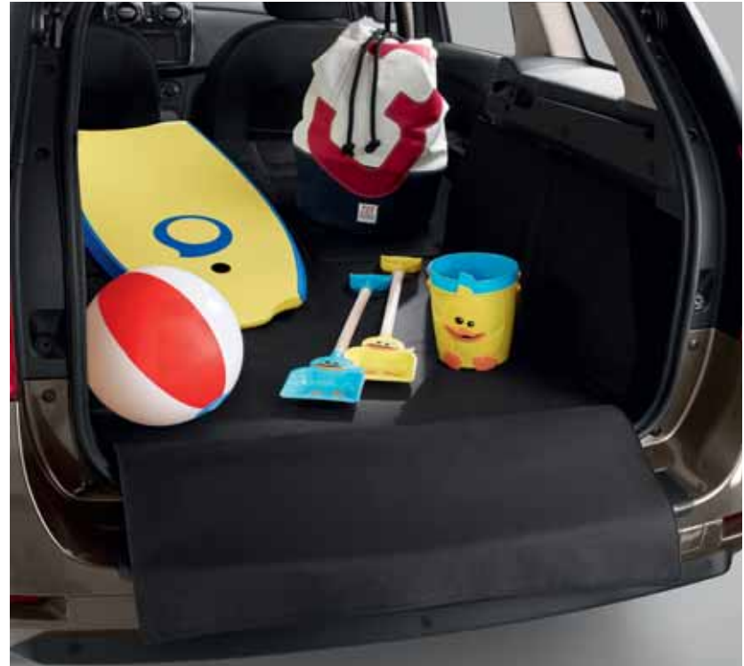
Килимок пропонується як аксесуар

Новий Renault Logan MCV пропонує простір, в якому Ви зможете перевезти будь-кого та будь-що. Цей 5-місний автомобіль подарує Вам комфортну подорож всією родиною у теплій атмосфері його інтер'єру. Logan MCV має неймовірні можливості для трансформації простору завдяки заднім сидінням, що складаються у пропорції 1/3 та 2/3, і величезному багажному відділенню. Він легко адаптується до Ваших потреб та буде ідеальним партнером у всіх Ваших справах.