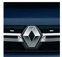
D42 СИНИЙ NAVY