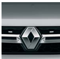
D69 СІРА ПЛАТИНА