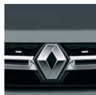
KPV СІРИЙ КАМІНЬ*