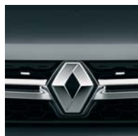
KNA СІРА КОМЕТА