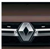
CNG КОРИЧНЕВИЙ ТУРМАЛІН