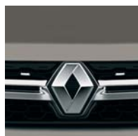
CNM КОРИЧНЕВИЙ ПОПІЛ