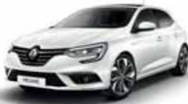
Bela perla (KB-P)