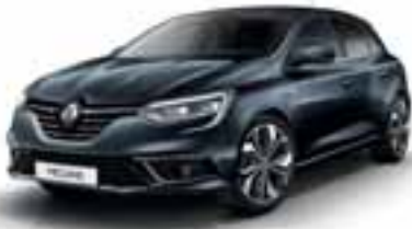
Siva Titanium (KB)