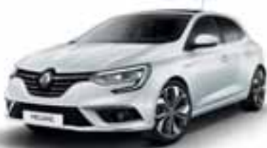
Ledeniško bela (EB)