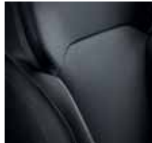
Temno blago (nevtralni šivi)