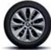
Jeklena platišča 41 cm (16") z okrasnimi pokrovi Florida