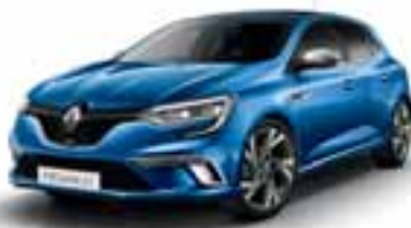
Modra Iron (KB-P)*