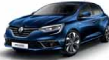
Modra Cosmos (KB)**