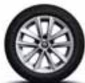
Platišča iz lahke litine 41 cm (16") Silverline