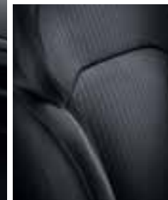
Temno blago (kontrastni šivi)