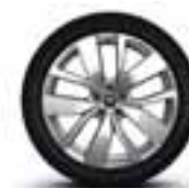
Platišča iz lahke litine 41 cm (16") Celsium