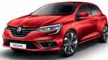
Rdeča Flamme (KB-P)