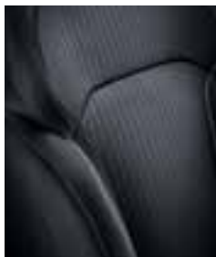
Temno blago (kontrastni šivi)