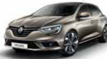
Bež Dune (KB)**