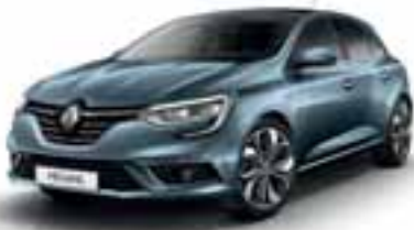
Modra Berlin (KB)