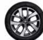
Platišča iz lahke litine 43 cm (17") Celsius