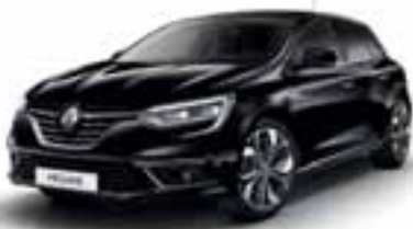
Črna Etoile (KB)