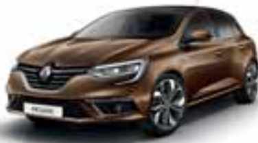
Rjava Kapučino (KB)**