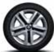
Jeklena platišča 41 cm (16") Flexwheel z okrasnimi pokrovi Complea