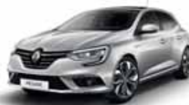
Platinasto siva (KB)