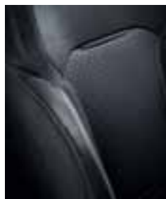
Temno blago v kombinaciji z imitacijo usnja