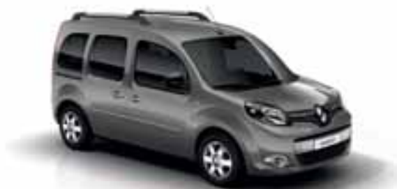
SIVA TAUPE (EB KNU)