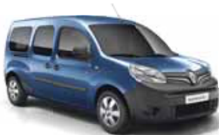
MODRA COSMOS (KB RPR)