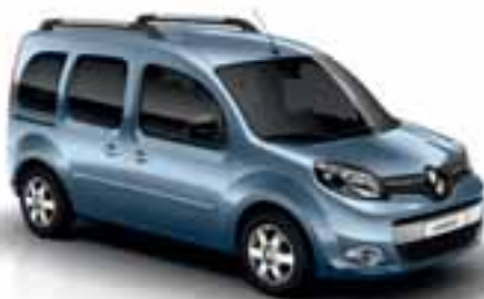
MODRA ETOILE (KB RNL)