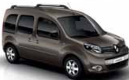
RJAVA MOKA (KB CNB)