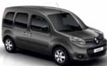
SIVA CASSIOPEE (KB KNG)