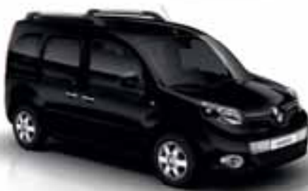
ČRNA METAL (KB GND)