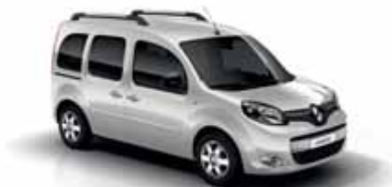
MINERALNO BELA (EB QNG)

NAVADNA ALI KOVINSKA ... BARVNA PALETA SE RADODARNO RAZKRIVA.