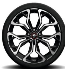
Platišča iz lahke litine 19" Diamond