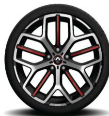
Platišča iz lahke litine 19" Trophy Akio