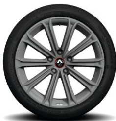
Platišča iz lahke litine 18" Estoril