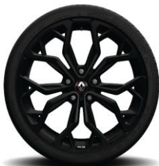
Platišča iz lahke litine 19" Diamond Black