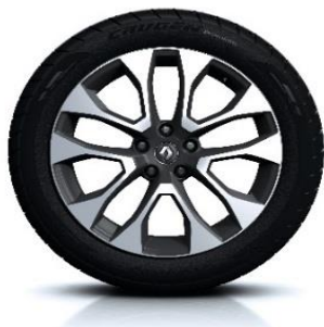
Platišča iz lahke litine 19" Proteus