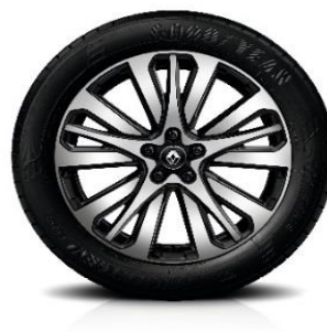
Platišča iz lahke litine 19" Initiale Paris