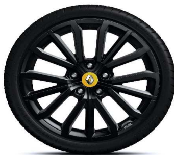
Platišča iz lahke litine 18" R.S. 18