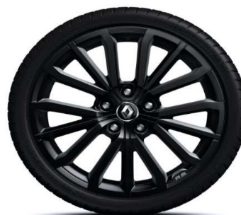
Platišča iz lahke litine 18" R.S.