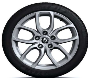
Platišča iz lahke litine 17" R.S.