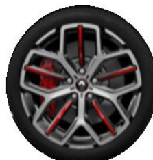
Platišča iz lahke litine 19" Trophy Akio