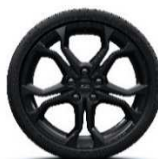
Posebna platišča iz lahke litine 18" Radica - črna