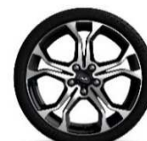
Platišča iz lahke litine 18" Radical - črna z diamantnim sijajem