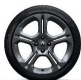
Posebna platišča iz lahke litine 17" GT - siva kovinska

S = Serija O = Opcija - = Ni na voljo P = V paketu