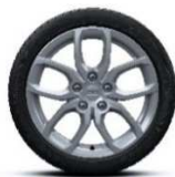
Posebna platišča iz lahke litine 17" R.S. Tibor