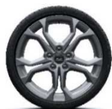
Posebna platišča iz lahke litine 18" Radica - siva