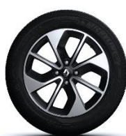
Platišča iz lahke litine 16" Limited