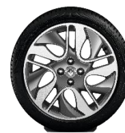
Platišča iz lahke litine 17" Tech Run