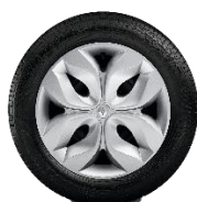
Okrasni pokrovi koles 15" Vivastella