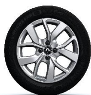
Platišča iz lahke litine 16" Celsium