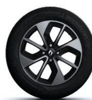
Platišča iz lahke litine 16" Limited - temna