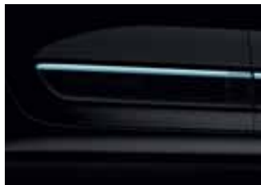
Stranski okrasni letvici v modri barvi