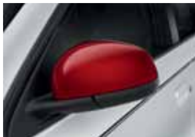
Ohišji zunanjih ogledal v rdeči barvi