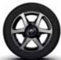
Platišča iz lahke litine 15" Argos