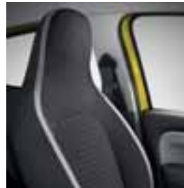
Sivo Java Natte oblazinjenje