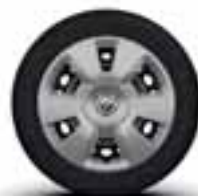
Veliki okrasni pokrovi koles v srebrni barvi 15"