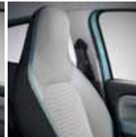
Modro Java Natte oblazinjenje