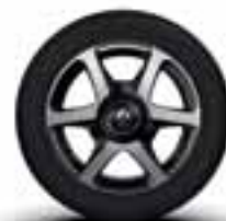
Platišča iz lahke litine 15" Argos