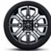
17" platišča Twin'Run z diamantnim leskom