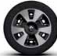
Veliki okrasni pokrovi 15" v srebrno - črni barvi