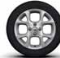
Platišča iz lahke litine 15" Exception