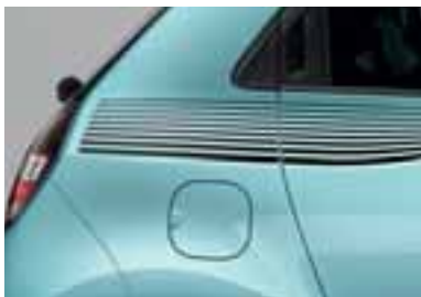
Okrasna nalepka Landscape v črni barvi (1)