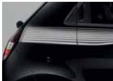
Okrasna nalepka Landscape v beli barvi (2)