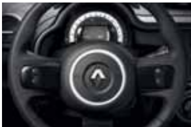
Vstavki na volanskem obroču v črni barvi

Vsaka notranja ureditev zajema volan ter obrobo osrednje konzole in obrobi zračnikov.