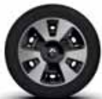
Veliki okrasni pokrovi koles 15" v srebrno - črni barvi