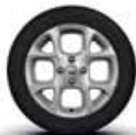
Platišča iz lahke litine 15" Exception