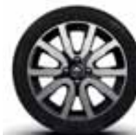
Platišča iz lahke litine 16" Embleme