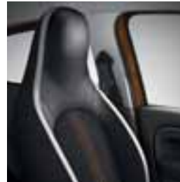
Oblazinjenje v sivi barvi