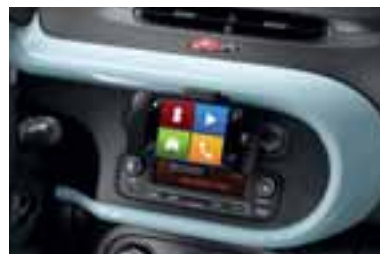
Obroba armaturne plošče v modri Pill barvi