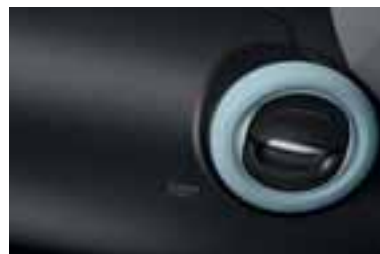
Obrobi zračnikov v modri Pill barvi