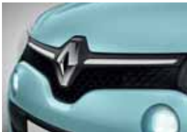
Prednja okrasna letvica v beli barvi

Paketi v posamezni barvi zajemajo prednjo okrasno letvico, stranski okrasni letvici in ohišji zunanjih ogledal.