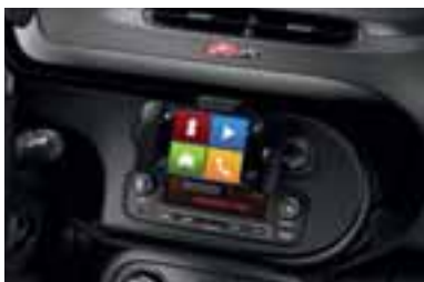
Obroba armaturne plošče v črni barvi