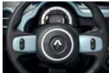
Vstavki na volanskem obroču v modri Pill barvi