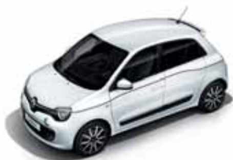
Bela Cristal (NB QNJ)