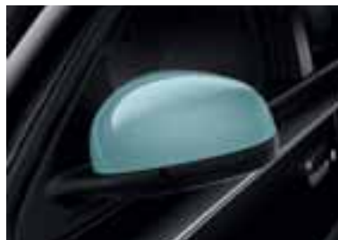
Ohišji zunanjih ogledal v modri barvi