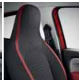
Rdeče Java Natte oblažinjenje