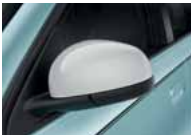
Ohišji zunanjih ogledal v beli barvi