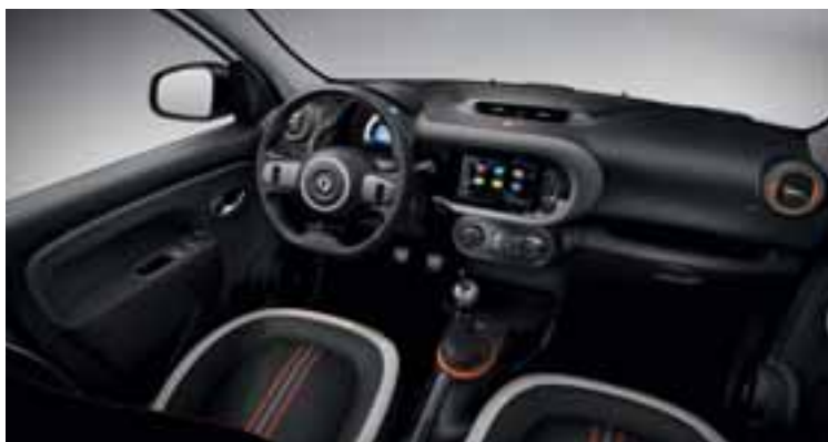
Notranji okrasni elementi v oranžni barvi

- Siva Cosmic, Črna Etoile in Bela Cristal