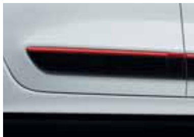
Stranski okrasni letvici v rdeči barvi