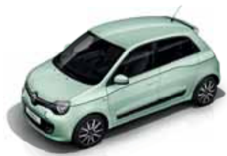
Zelena Pistacija (NPDPW)