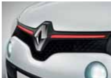
Prednja okrasna letvica v rdeči barvi