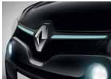
Prednja okrasna letvica v modri barvi