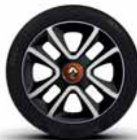
Posebna platišča iz lahke litine 16" Burning