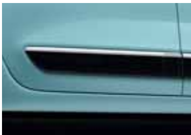
Stranski okrasni letvici v beli barvi