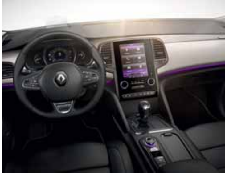
Slika je simbolna.