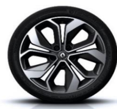
Platišča iz lahke litine 18" Grandtour