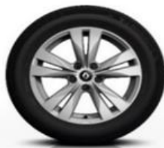
Platišča iz lahke litine 17" Bayadere