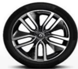
Platišča iz lahke litine 19" Alizarine *