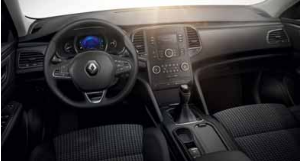
Slika je simbolna.