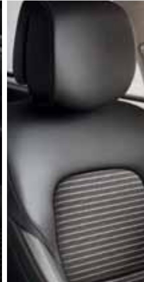
Oblazinjenje v kombinaciji tekstila in umetnega usnja ZEN