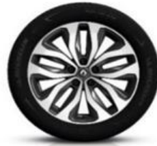
Platišča iz lahke litine 18" Duetto