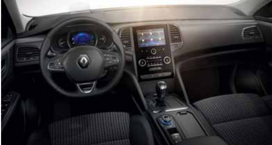
Slika je simbolna.