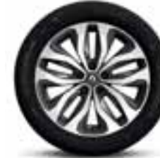
Platišča iz lahke litine 18" Duetto