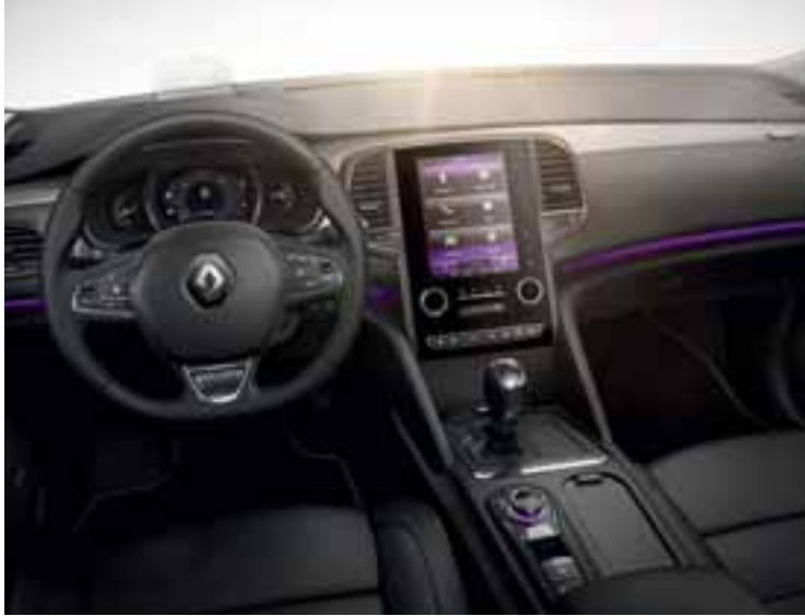
Slika je simbolna.