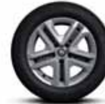
16" Flexwheel okrasni pokrov Complea