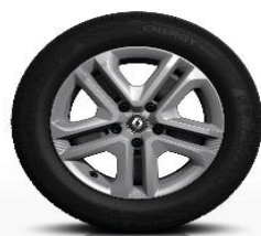
Jeklena platišča Flexwheel 16" z okrasnimi pokrovi Complea

S = Serija O = Opcija - = Ni na voljo * Na voljo v paketu