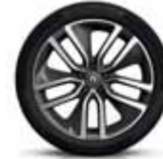
Platišča iz lahke litine 19" Alizarine (v paketu) (Opcijska platišča)