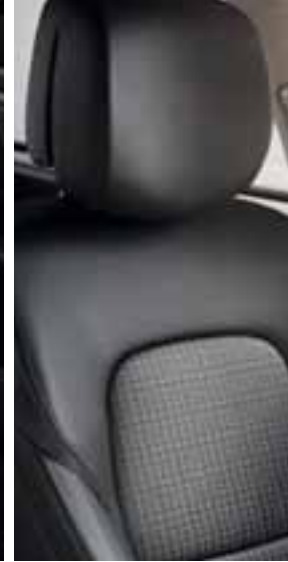
Oblazinjenje v tkanini - Titanium črna