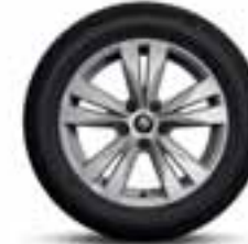
Platišča iz lahke litine 17" Bayadere