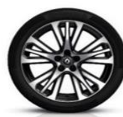
Platišča iz lahke litine 19" Initiale Paris