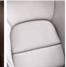
Oblazinjenje v usnju - Svetlo siva (Opcijsko)