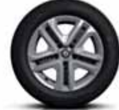
jeklena platišča Flexwheel 16" z okrasnimi pokrovi Complea (opcijsko)