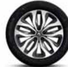
Platišča iz lahke litine 18" Duetto (Opcijsko)