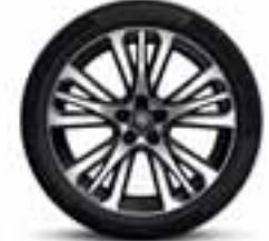
Platišča iz lahke litine 19" Initiale Paris