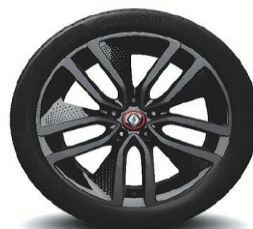
Platišča iz lahke litine 19" Alizarine Red