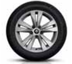
Platišča iz lahke litine 17" Bayader (Opcijska platišča)