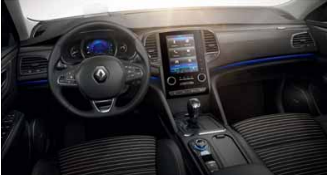
Slika je simbolna.