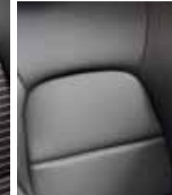
Oblazinjenje v usnju - Titanium črna (Opcijsko)