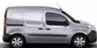
KANGOO EXPRESS & KANGOO Z.E.