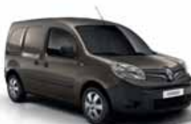
CAPUCCINO SMEĐA (MB CNB)