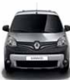
PREDNJI ODBOJNIK STYLE: DVOBOJNI ODBOJNIK MAT CRNE BOJE I U MAT KROMU, DODATNA SVJETLA I CRNA KUĆIŠTA SVJETALA