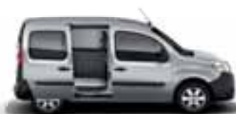
1 ILI 2 OSTAKLJENA BOČNA KLIZNA VRATA*