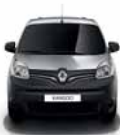
PREDNJI I STRAŽNJI ODBOJNIK I KUĆIŠTA VANJSKIH RETROVI- ZORA MAT CRNE BOJE