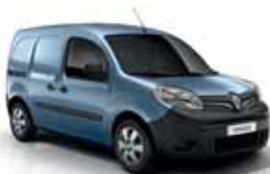
PLAVA ETOILE (MB RNL)