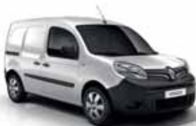
MINERALNO BIJELA (JB QNG)

ČAK SU I BOJE KANGOOA EXPRESS PRILAGOĐENE VAŠIM POTREBAMA. OSIM SERIJSKIH BOJA PRIKAZANIH U NASTAVKU, MOŽEMO ISPUNITI I VAŠE POSEBNE ZAHTJEVE U POGLEDU BOJA.