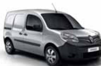
SIVA SILVER (MB KNX)