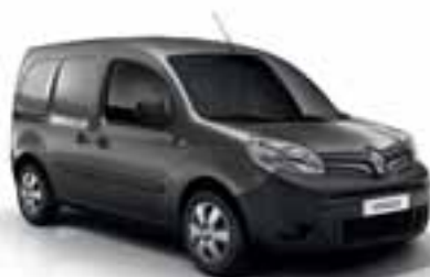
SIVA CASSIOPEE (MB KNG)