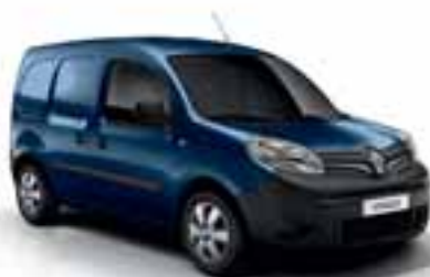
PLAVA COSMOS (MB RPR)*

JB: jednoslojna boja; MB: metalik boja; Fotografije nisu pravno obvezujuće. * Proverite kod vašeg prodavača