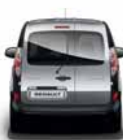
OSTAKLJENA ASIMETRIČNA STRAŽNJA VRATA S GRIJANIM STAKLOM I BRISAČEM STAKLA

*Kangoo Z.E. dostupan je samo u izvedbi s jednim bočnim kliznim vratima.