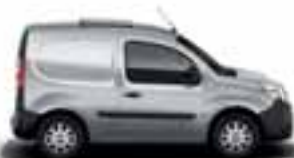
KANGOO EXPRESS COMPACT