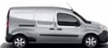
KANGOO EXPRESS MAXI & KANGOO MAXI Z.E.