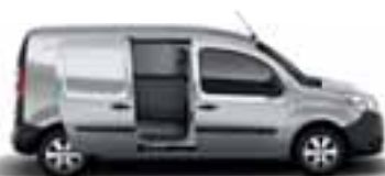
1 ILI 2 NEOSTAKLJENA BOČNA KLIZNA VRATA