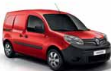
CRVENA VIF (JB 719)