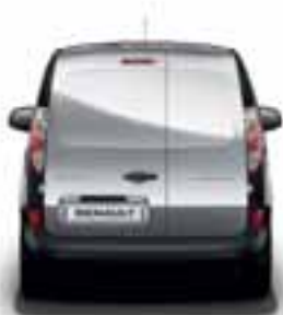
NEOSTAKLJENA ASIMETRIČNA STRAŽNJA VRATA