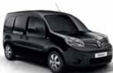
METALIK CRNA (MB GND)