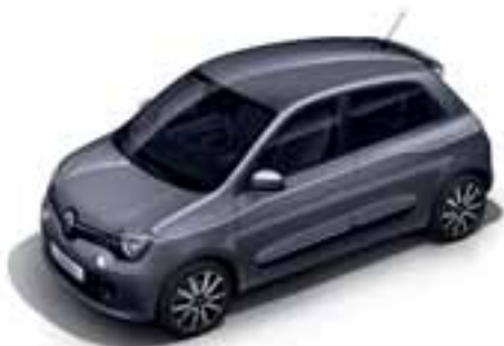
Siva Cosmic (MB KPE)