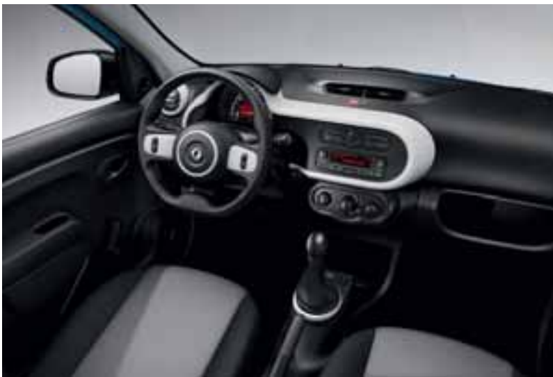
Na fotografiji može biti prikazana opcijnska oprema.