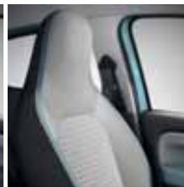
Presvlake plave boje Java Natte