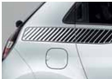
Ukrasne naljepnice Vintage (1)