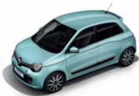
Plava Pill (NP RPP)