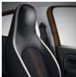
Presvlake u sivoj boji