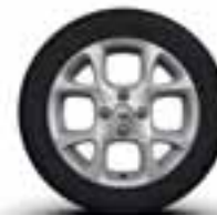
Aluminijski naplatci 15" Exception