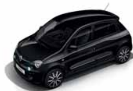
Crna Etoile (MB GNE)