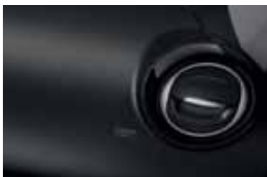
Obrubi ventilacijskih otvora crne boje