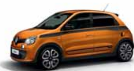
Narančasta Piment (MB EPP)

NB: nemetalik boja; NP: nemetalik posebna boja; MB: metalik boja; MP: metalik posebna boja.