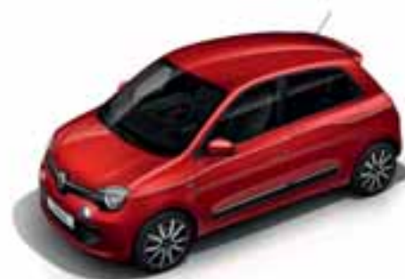
Crvena Flamme (MP NNP)