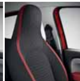
Presvlake crvene boje Java Natt e