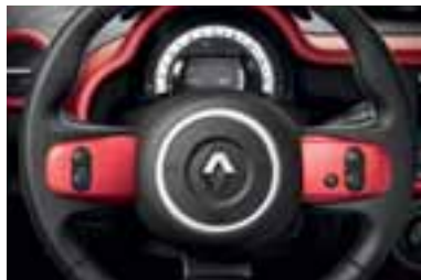
Umetci na upravljaču crvene boje