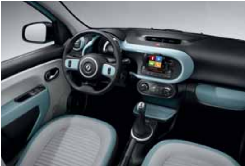
Na slici je prikazana opcjska oprema.