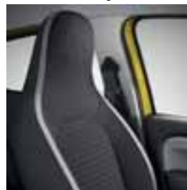
Presvlake sive boje Java Natt e