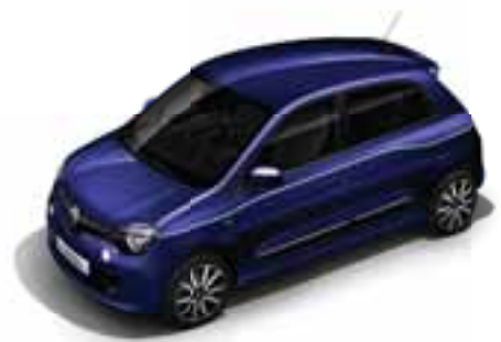
Ultra Ljubičasta (MP LNF)