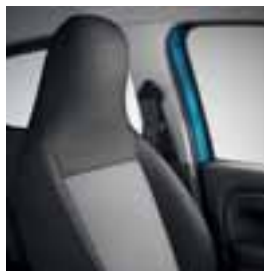
Presvlake crne boje Kario Elfa