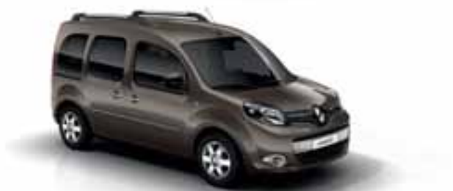
SMEĐA MOKA (MB CNB)