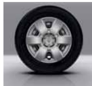
15-inčni ukrasni poklopci Egee

Svjetla za maglu sprijeda Klima uređaj Radio MP3 s AUX, USB i Bluetooth, integrirani zaslon Središnja konzola s naslonom za ruke Vozačevo sjedalo podesivo po visini Električno podizanje prednjih stakala, vozačevo impulsno Zračnik za stražnja sjedala Sjenilo za sunce na suvozačevoj strani Dodatna električna utičnica straga Putno računalo Potpune plastične obloge u teretnom prostoru Pretinac za odlaganje u stražnjim vratima Ostakljena lijeva klizna vrata Dio odbojnika u boji karoserije Električna, grijana vanjska osvrtna ogledala sjajnocrne boje Uzdužni krovni nosači Prednji plosnati brisači