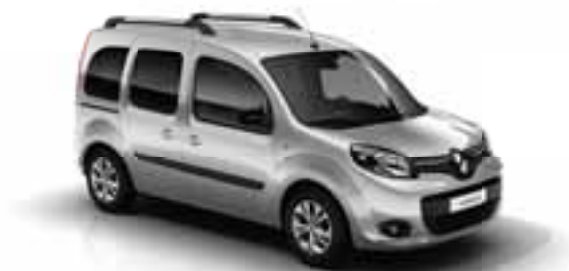
SIVA SILVER (MB KNX)