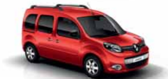
CRVENA VIF (JB 719)