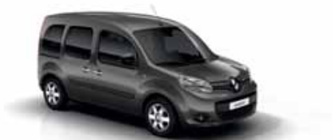
SIVA CASSIOPEE (MB KING)