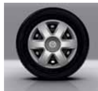
15-inčni ukrasni poklopci Brigantin

Volan podesiv po visini Stražnja klupa preklopiva u ravnu podnicu u omjeru 1/3-2/3 Sustav za pričvršćivanje dječjih sjedala ISOFIX na stražnjim bočnim sjedalima Prekrivalo prtljage Djelomične plastične obloge u teretnom prostoru Funkcija za ekovožnju Rezervni kotač standardnih dimenzija Ostakljena desna klizna vrata Fiksna stijena s prozorom umjesto lijevih kliznih vrata Ostakljena podizna stražnja vrata Brisač stražnjeg stakla Grijano stražnje staklo Tonirana stražnja stakla Električna, grijana vanjska osvrtna ogledala mat crne boje Crni odbojnici 15-inčni kotači s disk-kočnicama na svim kotačima