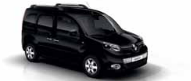
CRNA METAL (MB GND)