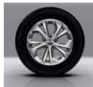
15-inčni naplatci Aria u boji Dark Metal

Tempomat Automatski klima uređaj Zatamnjena bočna stakla Električno preklopiva vanjska osvrtna ogledala Tri pretinca avionskog tipa ispod stropa Bočni zračni jastuci sprijeda i bočne zračne zavjese ESP + GC sistem Grip Control + HSA sistem Hill Start Assist Pomoć pri parkiranju straga Brisači sa senzorom za kišu Kožni upravljač Suvozačko sjedalo preklopivo u pod Odbojnici Luxe Stolici na stražnjim stranama sjedala Crna maska na svjetlima