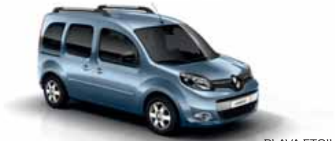
PLAVA ETOILE (MB RNL)