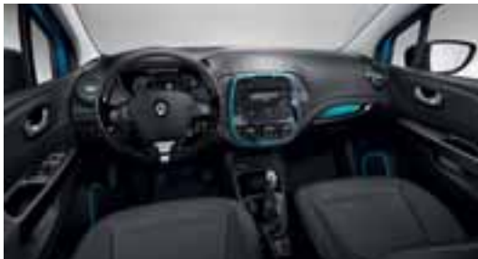
Paket Look (plava unutrašnjost)

Dostupni sa svijetlim ili tamnim uređenjem unutrašnjosti.