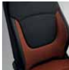
Presvlake u boji narančasta/tamnosiva Karbon