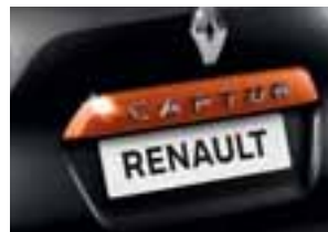
Narančasta letvica na stražnjim podiznim vratima