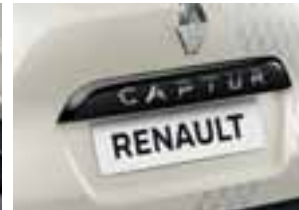
Crna letvica na stražnjim podiznim vratima