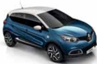
Plava Marine (NB) Krov u boji bjelokosti (NB)

Krov i vanjska ogledala u boji crna Etoile (MB)