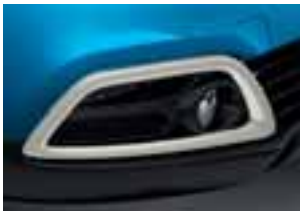
Okvir svjetala boje bjelokosti