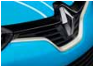
Profil prednje maske boje bjelokosti