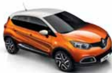
Narančasta Arizona (MB) Krov u boji bjelokosti (NB)

Krov i vanjska ogledala u boji crna Etoile (MB)