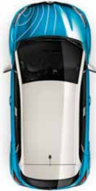
Naljepnica Map: na poklopcu motora i blatobranu s vozačeve strane