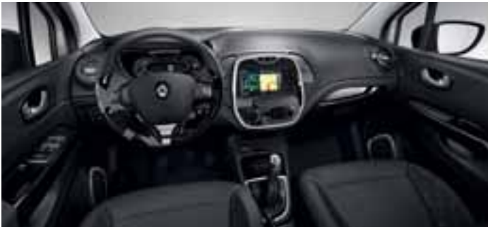
Tematski kromirani paket u unutrašnjosti (oprema Dynamique)