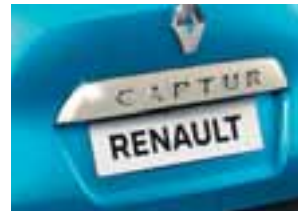
Letvica na stražnjim podiznim vratima boje bjelokosti