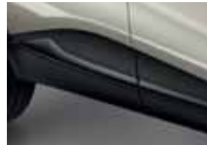
Crni bočni profil