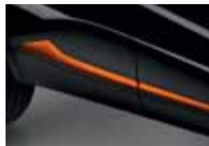
Bočni profil u narančastoj boji