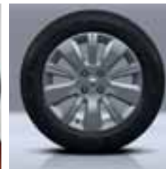
Aluminijski naplatci 16"