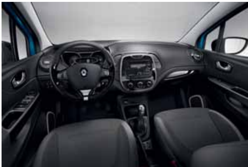
Na fotografiji može biti prikazana opcijnska oprema.