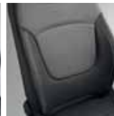
Presvlake u boji siva/boja bjelokosti