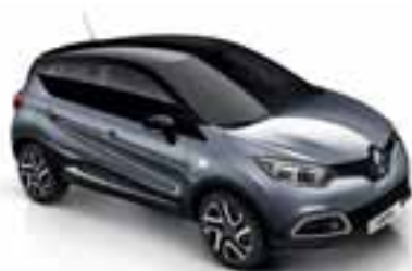
Siva Cassiopee (MB) Krov u boji crna Etoile (MB)