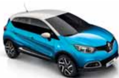
Plava Pacifique (MB) Krov u boji bjelokosti (NB)