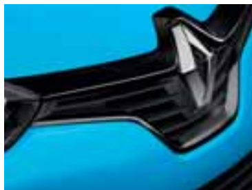
Crni profil prednje maske