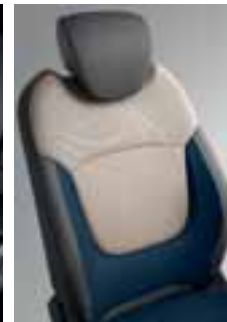
Dvobojne perive preslake u kombinaciji plave boje i boje bjelokosti s uzorkom Map