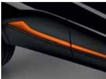
Narančasti bočni profil