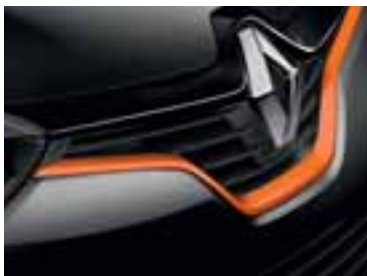
Narančasti profil prednje maske