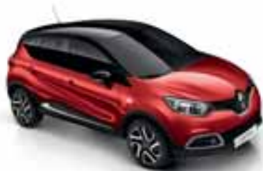
Crvena Flame (MB) Krov u boji crna Etoile (MB)