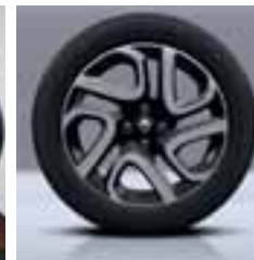
Aluminijski naplatci 17", srebrna