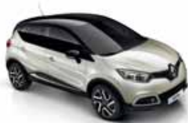
Boja bjelokosti (NB) Krov u boji crna Etoile (MB)

Krov i vanjska ogledala u boji narančasta Arizona (MB)