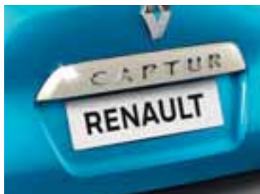
Letvica na stražnjim podiznim vratima u boji bjelokosti