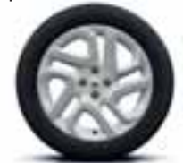
17" aluminijски naplatci boje bjelokosti dijamantnog sjaja