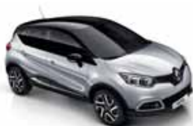
Siva Platine (MB) Krov u boji crna Etoile (MB)