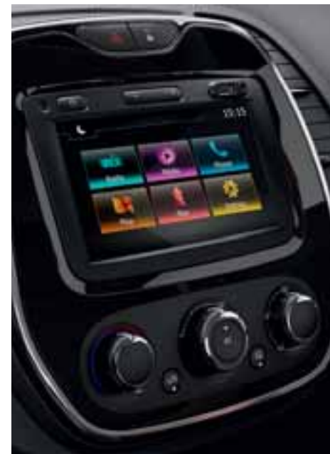
Multimedijски sustav Media Nav Evolution

Sustav nudi širok raspon pametnih i praktičnih funkcija kao što su Navteq navigacijski sustav, radio, USB priključak, Bluetooth®, telefoniranje bez ruku ... Sa sustavom Renault MEDIA NAV Evolution sve glavne funkcije multimedijskog sustava su vam na dohvat ruke.