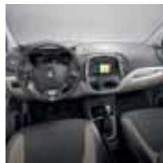
Kombinacija svjetle unutrašnjosti (opcijnsko)

Na fotografiji može biti prikazana opcijnska oprema.