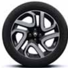
17" aluminijски naplatci crne boje dijamntnog sjaja