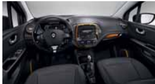
Paket Look (narančasta unutrašnjost)