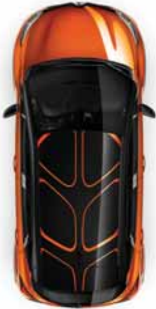
Naljepnica Captur: na krovu