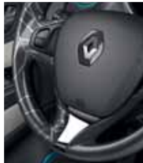
Upravljač s uzorkom Map