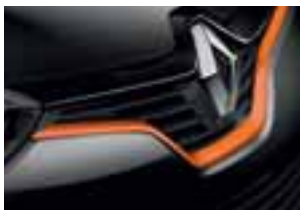
Narančasti profil prednje maske