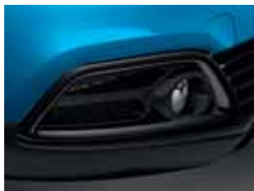
Crni okvir svjetala