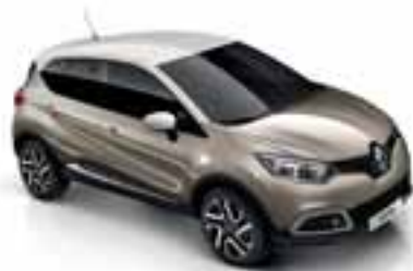
Bež Cendre (MB) Krov u boji bjelokosti (NB)

Krov i vanjska ogledala u boji crna Etoile (MB)