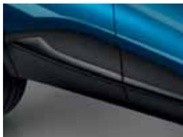
Crni bočni profil