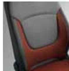
Presvlake u boji narančasta/boja bjelokosti