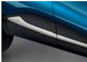
Bočni profil boje bjelokosti