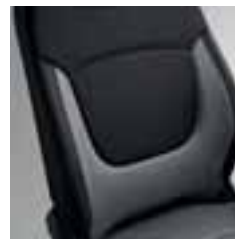
Presvlake u boji siva/tamnosiva Karbon