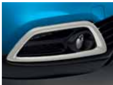
Okvir svjetala u boji bjelokosti