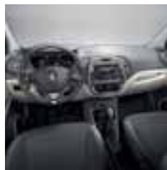
Kombinacija svjetle unutrašnjosti (opcijnsko)