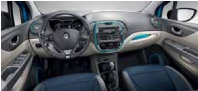
Tematski paket u unutrašnjosti Map