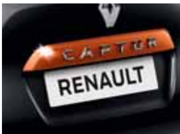
Narančasta letvica na stražnjim podiznim vratima