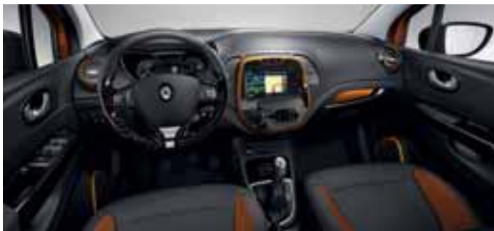
Tematski paket u unutrašnjosti Captur