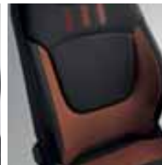
Perive dvobojne presvlake s narančastim i tamnosivim motivom