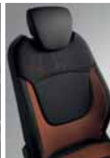
Perive dvobojne preslake u kombinaciji narančaste Arizona i tamnosive boje s uzorkom Captur