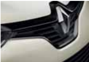
Crni profil prednje maske