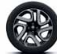
17" aluminijски naplatci narančaste boje dijamantnog sjaja