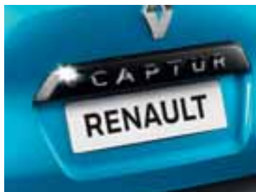
Crna letvica na stražnjim podiznim vratima