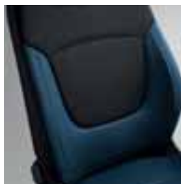
Presvlake u boji plava/tamnosiva karbon s kombinacijom tamne unutrašnjosti