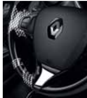
Upravljač s uzorkom Losange