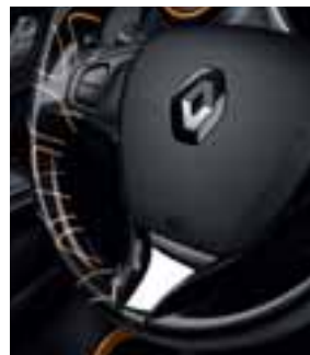
Upravljač s uzorkom Captur