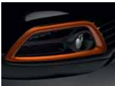
Narančasti okvir svjetala