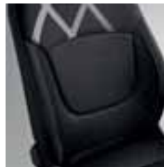
Perive dvobojne presvlake s motivom Losange