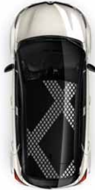
Naljepnica Losange: na krovu i stražnjim podiznim vratima