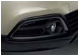
Crni okvir svjetala