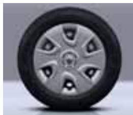
Ukrasni pokrov kotača Extreme 16"

Na fotografiji može biti prikazana opcijnska oprema.