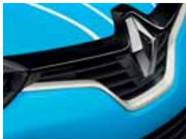
Profil prednje maske u boji bjelokosti