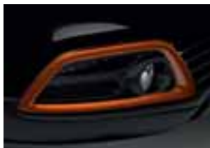
Narančasti okvir svjetala