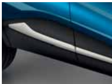
Bočni profil u boji bjelokosti