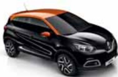
Crna Etoile (MB) Krov u boji narančasta Arizona (MB)