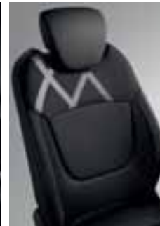
Tamnosive perive presvlake s uzorkom Losange