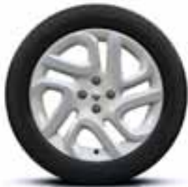
17" aluminijски naplatci boje bjelokosti dijamantnog sjaja

Vezani uz dodatno zatamnjena stražnja stakla