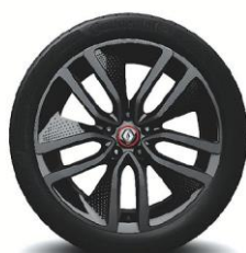
Aluminijski naplatci 19" Alizarine Red