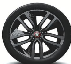
Aluminijski naplatci 19" Alizarine Red