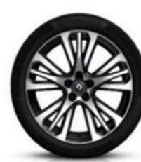
Aluminijski naplatci 19" Initiale Paris