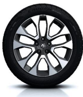
Aluminijski naplatci 19" Proteus