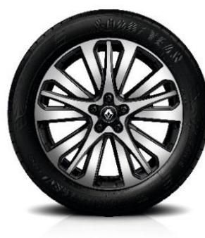
Aluminijski naplatci 19" Initiale Paris