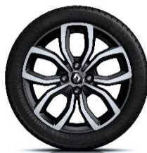
16" aluminijski naplatci Pulsizer - Crna