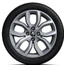
16" aluminijski naplatci Pulsizer - Krom