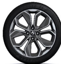
17" aluminijski naplatci Optemic - Krom&Siva