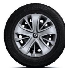
Ukrasni pokrovi kotača Lagoon 15"