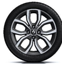
16" aluminijski naplatci Pulsizer - Siva