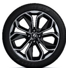
17" aluminijski naplatci Optemic - Krom&Crna