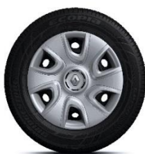
Ukrasni pokrovi kotača Extreme 15"