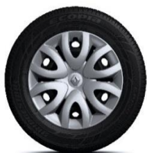
Ukrasni pokrovi kotača Paradise 15"