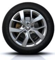
Aluminijski naplatci 16" Celsius