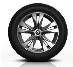
Aluminijski naplatci 17" Bayadere