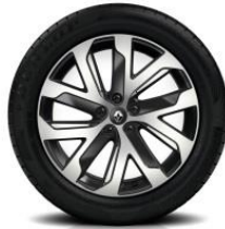
Aluminijski naplatci 19" Quartz