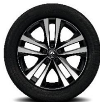
Aluminijski naplatci 18" Argonaute