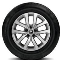
Aluminijski naplatci 17" Aquilai

S = Serija O = Opcija P = u paketu - = nije dostupno