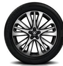
Aluminijski naplatci 19" Initiale Paris