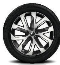
Aluminijski naplatci 19" Quartz Crna