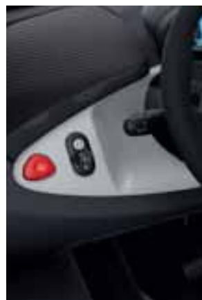
UMETCI U BIJELOJ BOJI