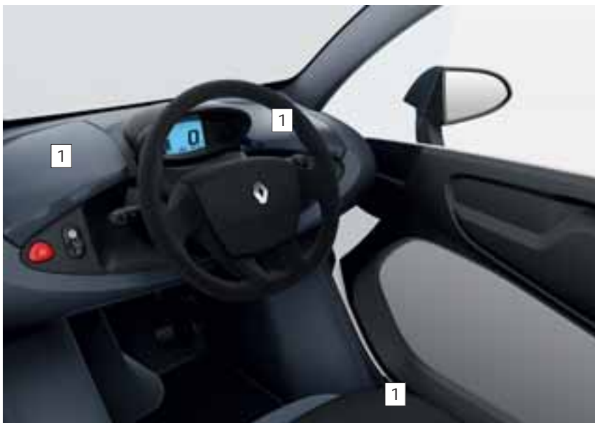
UNUTRAŠNJOST U TAMNOJ BOJI (SERIJSKI)