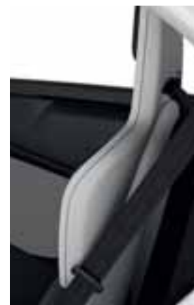
OKVIR SJEDALA U BIJELOJ BOJI