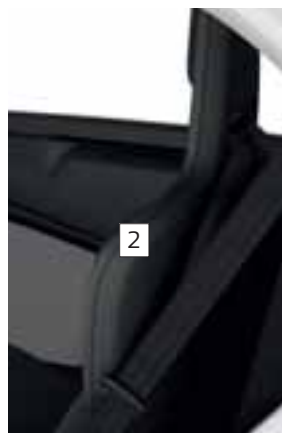
OKVIR SJEDALA U TAMNOJ BOJI (SERIJSKI)