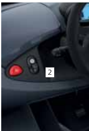
UMETCI U TAMNIM BOJAMA (SERIJSKI)