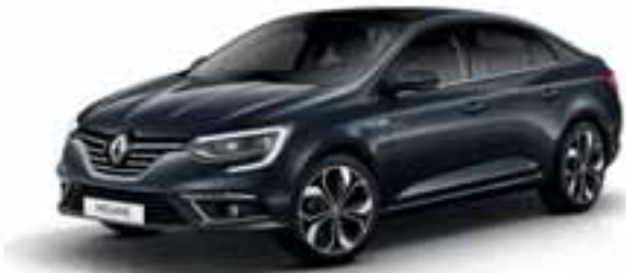
Siva Titanium (MB)