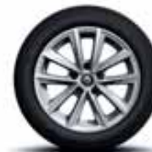
Aluminijski naplatci 16" Silverline