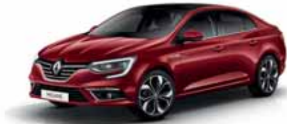
Crvena Intens (MB-P)