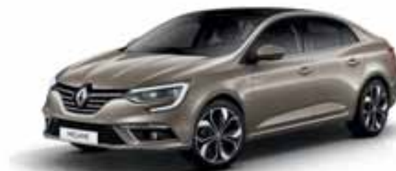
Bež Dune (MB)