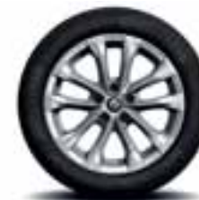
Aluminijski naplatci 17" Exception (Opcijski naplatci)