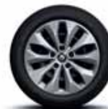
Čelični naplatci 16" s ukrasnim pokrovima kotača Florida