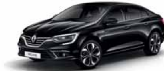
Crna Etoile (MB)