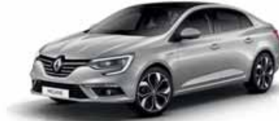
Alu Siva (MB)