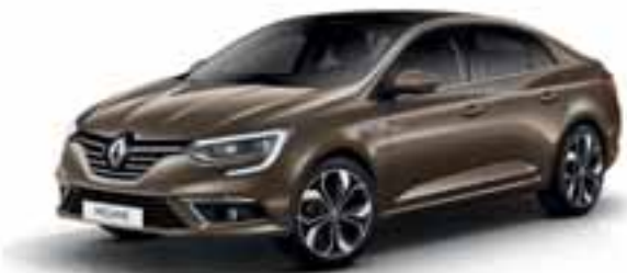
Smeđa Vison (MB)