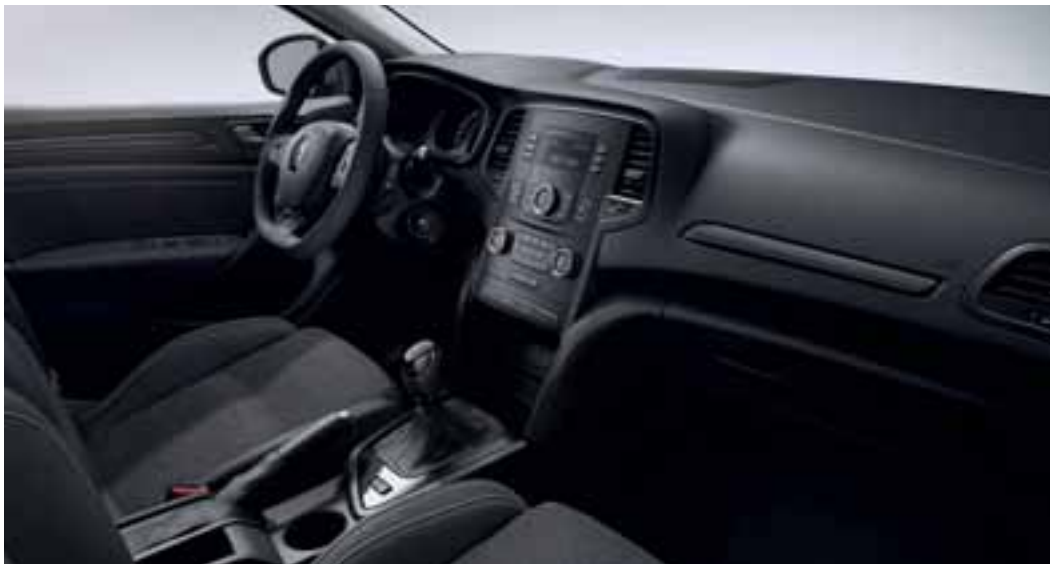
Slika je simbolična.