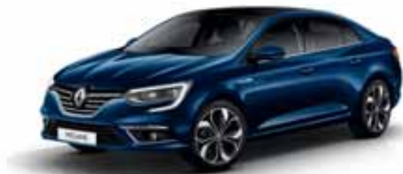
Plava Cosmos (MB)