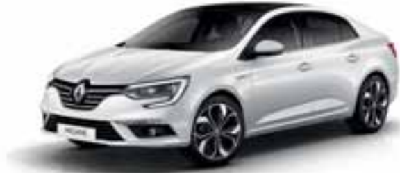
Perla bijela (MB-P)