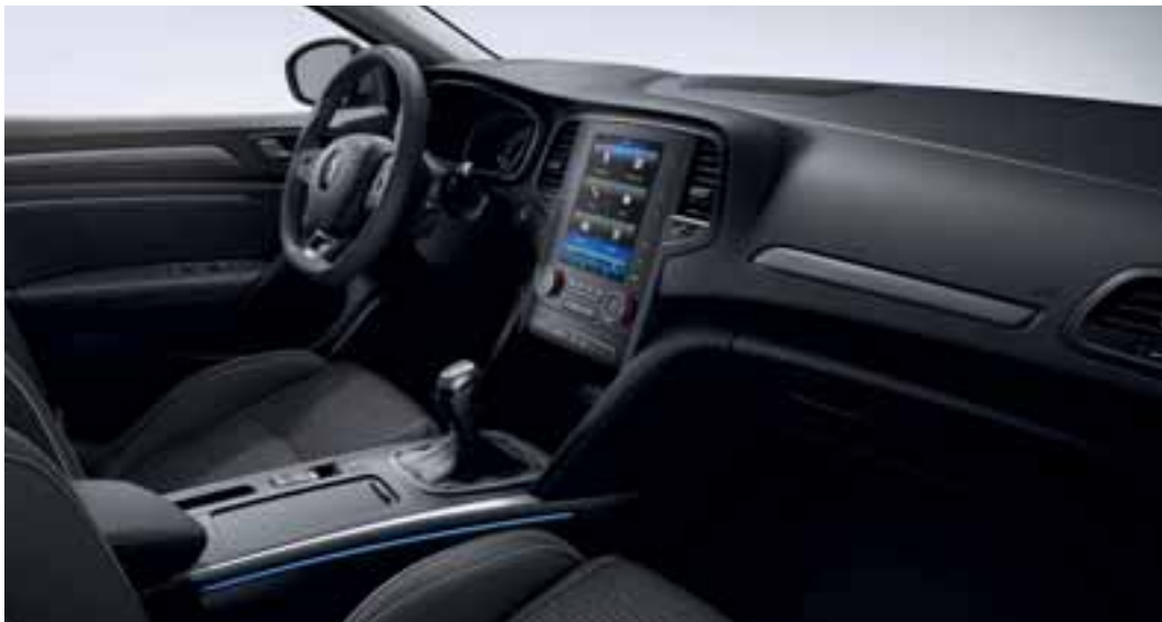
Slika prikazuje opcijsku opremu.