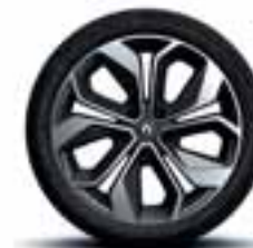
Aluminijski naplatci 18" Grandtour (Opcijski naplatci)