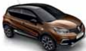
Smeđa Cappuccino (PE)* Krov crna Étoilé (PE)