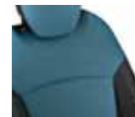
Presvlake u kombinaciji - sjedište: crna / naslon: plava