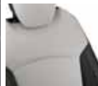
Presvlake u kombinaciji - sjedište: crna / naslon: boja bjelokosti