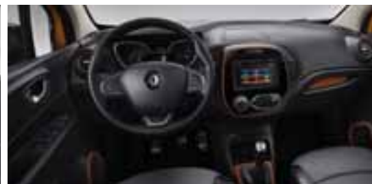
Paket LOOK UNUTRAŠNOST - Narančasta