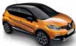
Narančasta Atacama (PE) Krov crna Étoilé (PE)