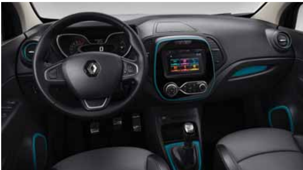
Paket LOOK UNUTRAŠNOST - Plava