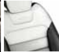
Presvlake od Nappa kože u kombinaciji svijetle i tamne boje