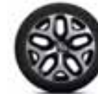
Aluminijski naplatci 17" Emotion - Crna