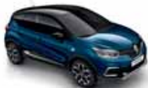
Plava Océan (PE) Krov crna Étoilé (PE)