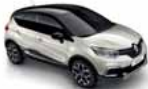
Boja bijelokosti (NL)* Krov crna Étoilé (PE)