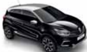
Crna Étoilé (PE)* Krov siva Platine (PE)