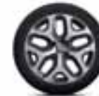
Aluminijski naplatci 17" Emotion - Siva