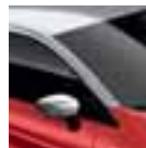
Krov siva Platine (PE)