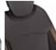
Presvlake u kombinaciji - sjedište: crna / naslon: narančasta