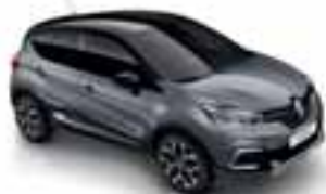
Siva Cassiopée (PE)* Krov crna Étoilé (PE)