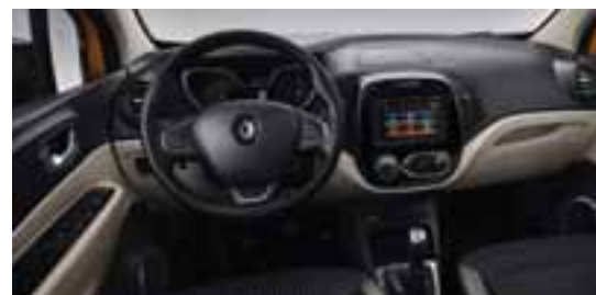
Unutrašnjost u kombinaciji svijetle i tamne boje