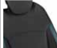
Perive presvlake u boji - sjedalo: crna / naslon: plava (1)