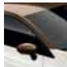
Krov u boji smeđa Cappuccino (PE)