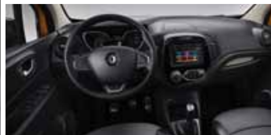
Paket LOOK UNUTRAŠNOST - Krom