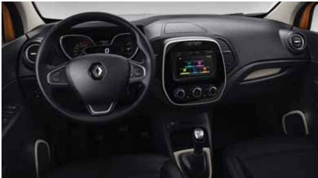
Unutarnja oprema u kontrastnim bojama