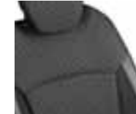
Perive presvlake u boji - sjedalo: crna / naslon: boja bjelokosti (1)