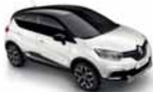
Perla bijela (PE)* Krov crna Étoilé (PE)