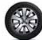
Aluminijski naplatci 16" Adventure