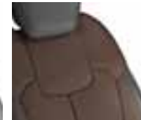
Presvlake u kombinaciji umjetne kože i svjetlonarančaste boje