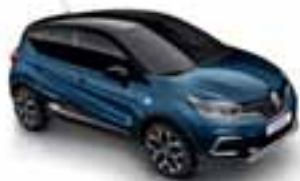
Plava Marine (NL) Krov crna Étoilé (PE)