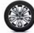
Aluminijski naplatci 17" Initiale Paris