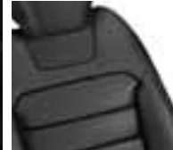
Presvlake od Nappa kože u crnoj boji