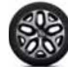
Aluminijski naplatci 17" Emotion - Crna