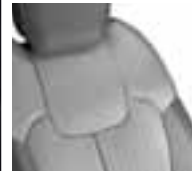
Presvlake u kombinaciji umjetne kože i svjetlosive boje