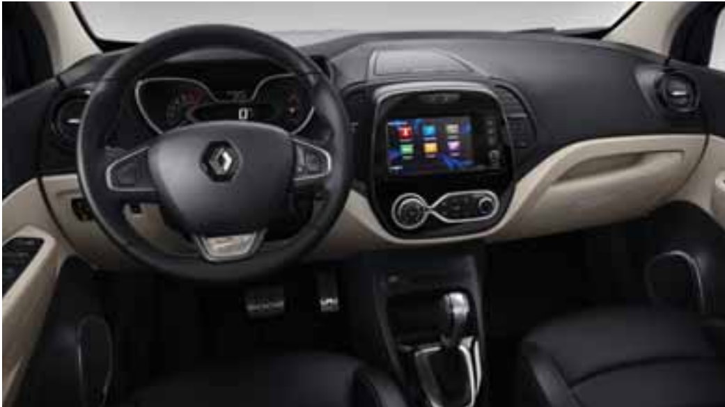
Unutarnja oprema u kontrastnim bojama