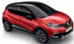
Crvena Flamme (PE)*** Krov crna Étoilé (PE)