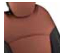
Presvlake u kombinaciji - sjedište: crna / naslon: narančasta