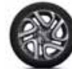
Aluminijski naplatci 17" Fastgame