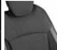
Perive presvlake u boji - sjedalo: crna / naslon: boja bjelokosti (1)