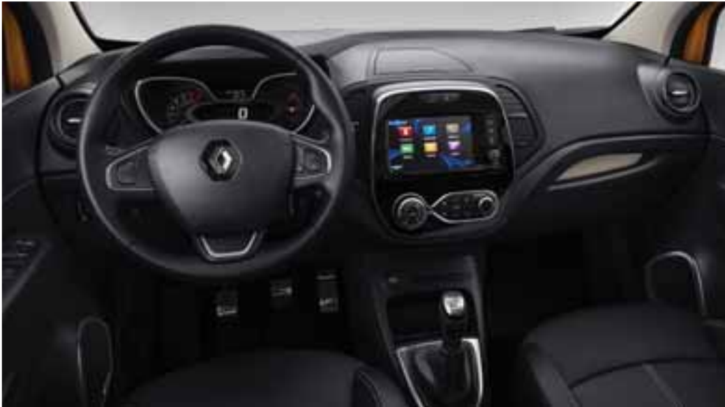
Unutarnja oprema u kontrastnim bojama