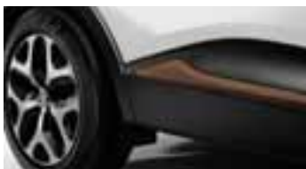
Paket LOOK VANJSKI IZGLED - Cappuccino