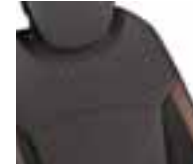
Perive presvlake u boji - sjedalo: crna / naslon: narančasta (1)