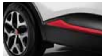
Paket LOOK VANJSKI IZGLED - Crvena