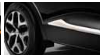
Paket LOOK VANJSKI IZGLED - Boja bjelokosti