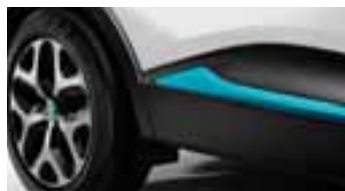
Paket LOOK VANJSKI IZGLED - Plava