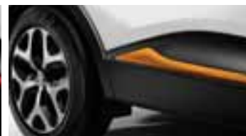
Paket LOOK VANJSKI IZGLED - Narančasta