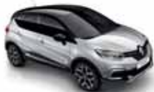
Siva Platine (PE)* Krov crna Étoilé (PE)