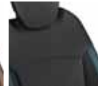
Perive presvlake u boji - sjedalo: crna / naslon: plava (1)