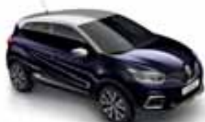
Crna Améthyste (PE)** Krov siva Platine (PE)