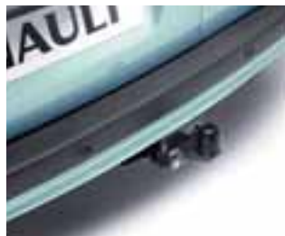
Kuke za vuču