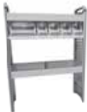
Pokretna radionica Kangoo