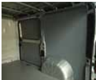
Zaštita prtljažnog prostora