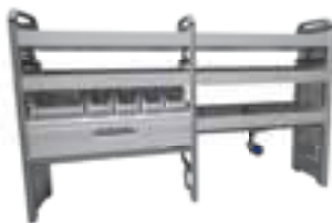
Pokretna radionica Master