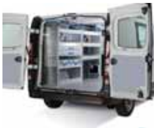
Pokretna radionica Trafic