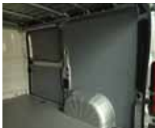
Zaštita prtljažnog prostora