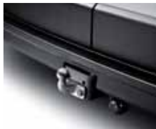
Kuke za vuču