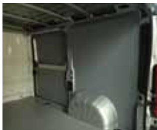
Zaštita prtljažnog prostora

Ponuda dodatne opreme za Renault Kangoo.