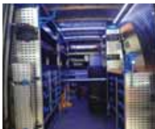
Sigurnost i rasvjeta