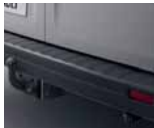
Kuke za vuču