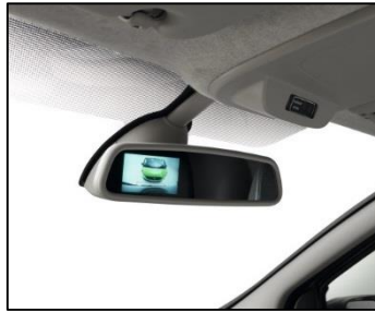
Bakkamera med visning i bakspejl