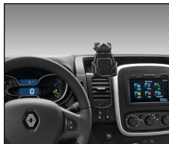
SmartDock-holdere til telefon