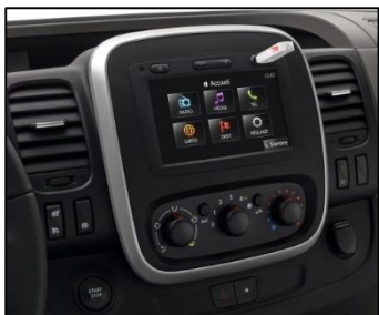
MediaNav navigation med 7" touchscreen