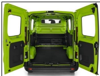
Sidebeklædning i plastik