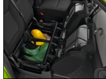
Foldbar passagerbænk m. opbevaring