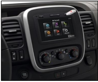
MediaNav navigation med 7" touchscreen