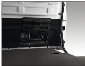
Luge under passagersæde, der kan åbnes og give ekstra lastlængde i varerum