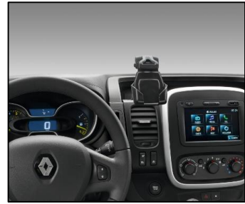
SmartDock-holdere til telefon