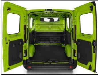
Sidebeklædning i plastik