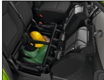
Foldbar passagerbænk m. opbevaring