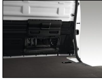
Luge under passagersæde, der kan åbnes og give ekstra lastlængde i varerum