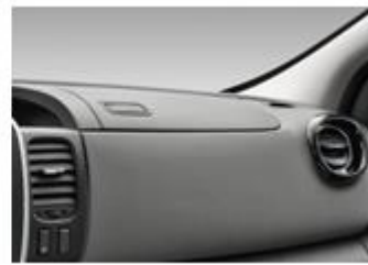
Interiørdetaljer i alu-finish og låg til handskerum i instrumentbordets top