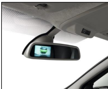
Bakkamera med visning i bakspejl