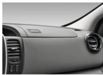
Interiørdetaljer i alu-finish og låg til handskerum i instrumentbordets top