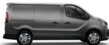
Bilerne er vist med ekstraudstyr