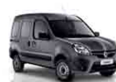
CINZA QUARTZ (PM)