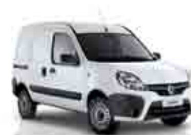
BRANCO GLACIER (CO)