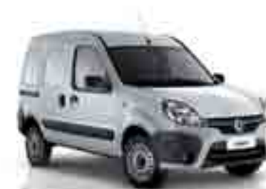
PRATA ÉTOILE (PM)